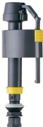
M5350 MOEN Universal Fill Valve Robinet de remplissage universel MOEN Válvula de Llenado Universal MOEN